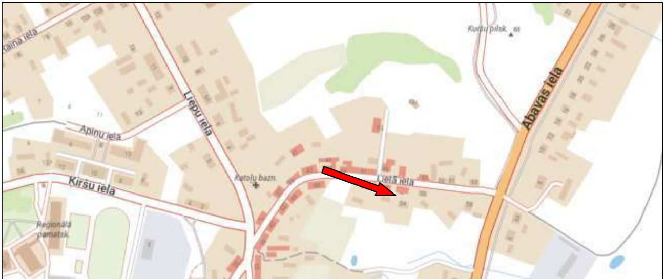
Izkopējums no attīstības plāna plānotā/atļautā izmantošana